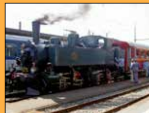
Mallet Ed 2x 2/2, Baujahr 1893 der OeBB