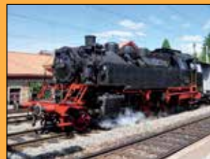
Tenderlok 64 518, Baujahr 1940 des VHE