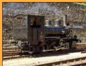
E 3/3 Chluser-Schnägg (Baujahr 1899) der OeBB