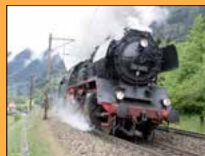
BR 50 3673, Associazione Verbano Express, Bj. 1941