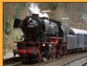
BR 23 058 der MSaH/Eurovapor, Baujahr 1955