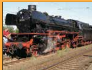
BR 41 018, Baujahr 1939 der Dampfloks-Gesellschaft München e.V.